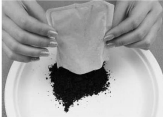
圖 1 市售暖暖包

市售暖暖包(如下圖 1 所示)中常加入蛭石,其功用為跟空氣接觸後,能快速地吸收空氣中水分,加速鐵粉的氧化速率,進而放熱達成暖暖包的效果。 小育 想要以咖啡渣(如下圖 2 所示)來取代暖暖包內容物—蛭石,以期減少廢棄量。因此進行以下兩組實驗: