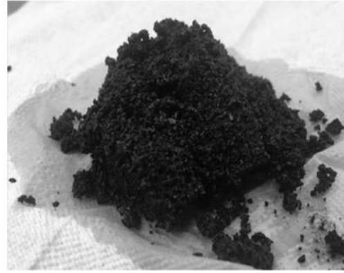
圖 2 咖啡渣